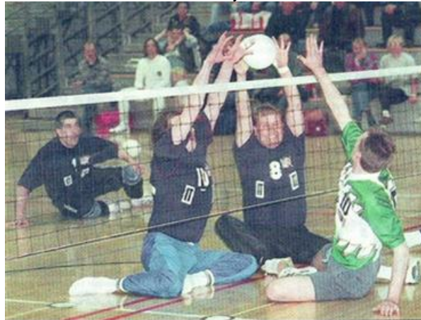
Kuva v. 1991 ottelusta ESI-Team – Savico Tubanten

Nestori Miikkulainen on edesmenneen laulajan, sanoittajan ja säveltäjän Juha Vainion henkilöahmo kauniista balladista "Vanhoja poikia viiksekkäitä", joka kertoo Saimaan yksinäisessä saassa asustelevista kaveruksista: vanhapoika N. Miikkulaisesta ja saman alan norpasta, Saimaan hylkeestä. Laulu on myös kannanotto rauhoitetun ja uhanalaisen Saimaan Norpan suojelun puolesta - kuin myös alkuperäisen saaristolaiselämänkin.